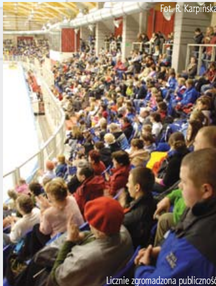
Licząco zgromadzona publiczność