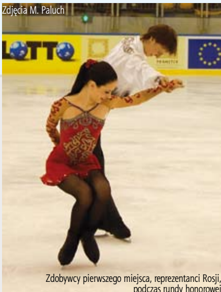
Zdobywcy pierwszego miejsca, reprezentanci Rosji, podczas rundy honorowej