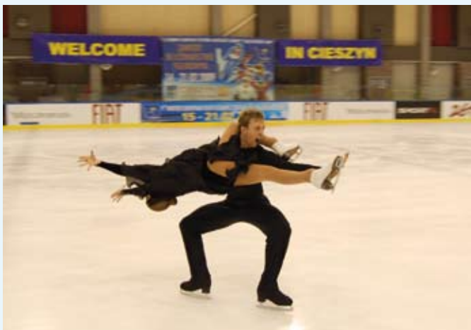
Brytyjska para podczas treningu