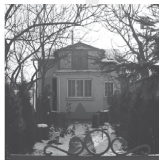
„Antonina i Józef”, jedna z prac prezentowanych na wystawie

bardziej kolorowa druga mniej. Tak samo jest z właścicielami. Każdy z nich ma swoje małe radości i małe smutki związane z działkowymi sprawami. Mimo to, wszyscy zgodnie przyznają, że nie wyobrażają sobie nie mieć takiego miejsca. Oszałeliby. Ogródki działkowe, które fotografowałam są własnością zakładów metalowych im. Szatkowskiego. Mieszczą się w Nowej Hucie, dzielnicy Krakowa (A. Bystrowska”).