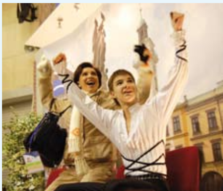
Zwycięzca w kategorii solistów, Viktor Romanenkov (Estonia) wraz z trenerką

W dniach 15 – 20 lutego Cieszyn miał niepowtarzalną okazję gościć u siebie sportowców z 30 europejskich krajów, którzy zafundowali Cieszyńsiakom widowisko sportowe na najwyższym poziomie. Wszystko za sprawą IX Zimowego Olimpijskiego Festiwalu Młodzieży Europy „Śląsk – Beskidy 2009”, w ramach którego na obiekcie nowo powstałej hali widowiskowo – sportowej rozegrane zostały konkurencje łyżwiarstwa figurowego.